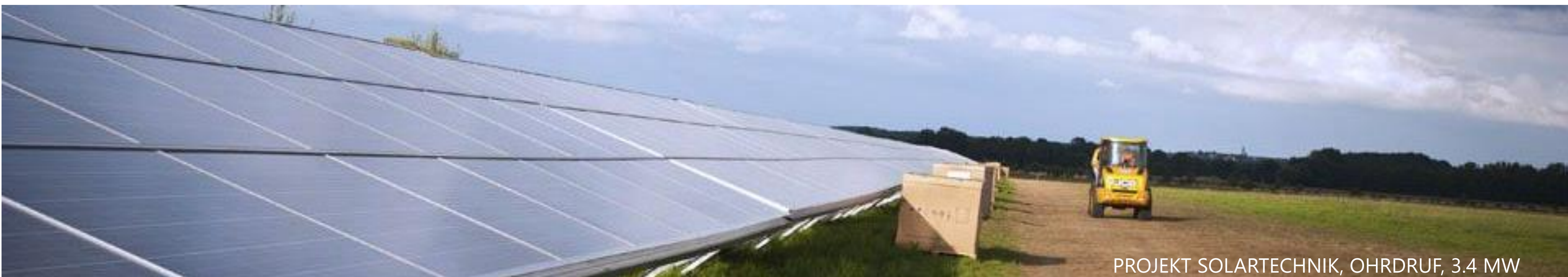
PROJEKT SOLARTECHNIK, OHRDRUF, 3.4 MW

Na życzenie klienta udostępniamy również referencje w formie skanów dokumentów.